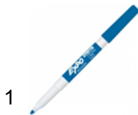
1 dry erase whiteboard markers EXPO - FINE TIP