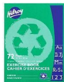
2 green exercise book