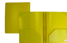
4 portfolio with 2 pockets

*PLEASE MAKE SURE ALL ITEMS ARE LABELED WITH YOUR CHILD'S NAME