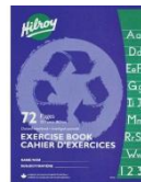
3 blue exercise book