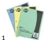
1 Hilroy Canada Exercise Book