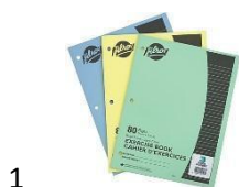
1 cahier d'exercices Hilroy