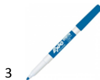
3 Marqueurs effaçables à sec pour tableau blanc EXPO ou BIC POINTE FINE