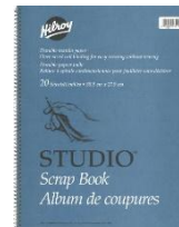
3 Scrapbook Hilroy bleu

*S.V.P.VEUILLER ÉTIQUETER TOUS LES EFFETS SCOLAIRES AVEC LE NOM DE VOTRE ENFANT