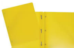
2 Duotang-with brass fasteners, no pockets