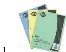
1 cahier d'exercices Hilroy