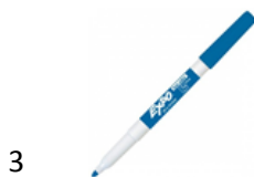
3 Marqueurs effaçables à sec pour tableau blanc POINTE FINE