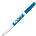
EXPO dry erase whiteboard marker FINE TIP