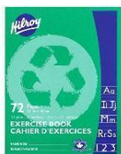
2 cahier vert